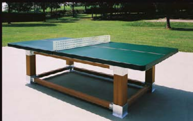
Table de ping pong