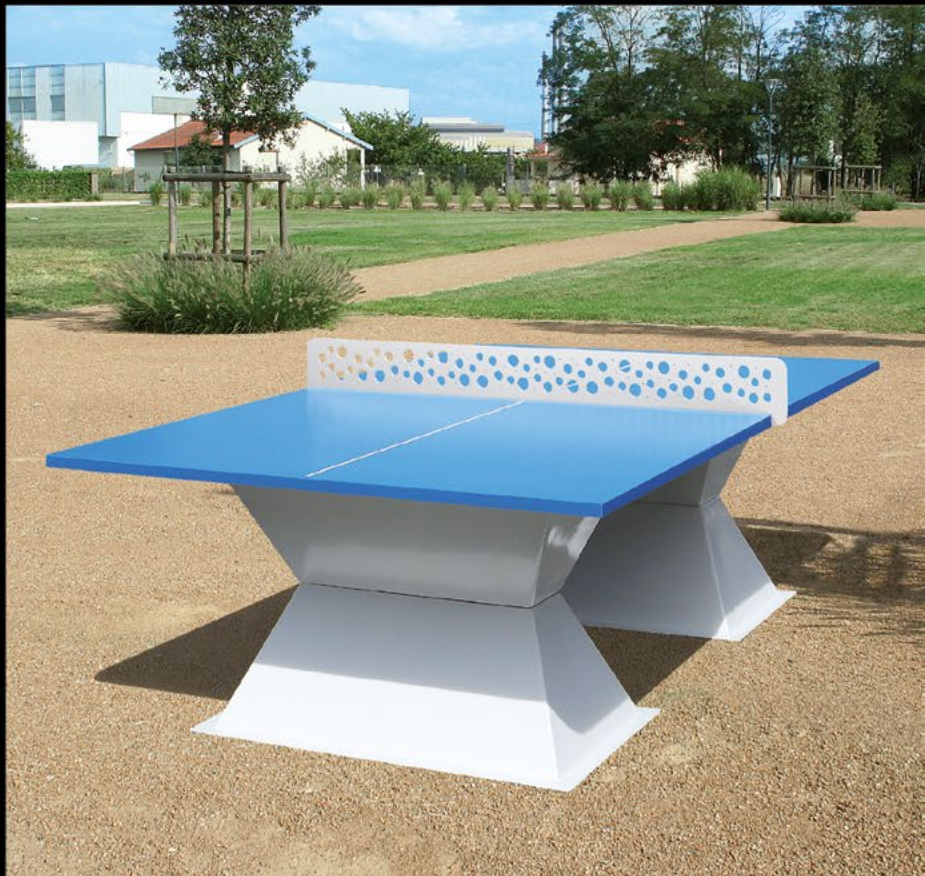
Table de ping-pong Diabolo 35