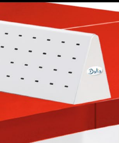
Table de ping-pong Diabolo 60