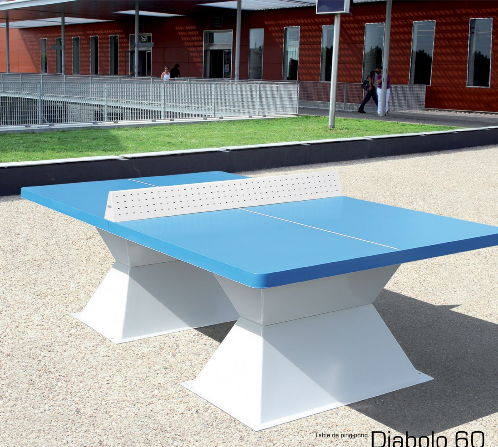
Table de ping-pong Diabolo 60

Quand l'équipement de loisir participe à l'architecture et au paysage